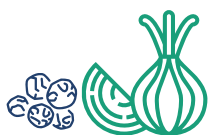
Cebolla y pimienta gorda